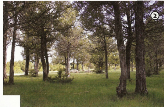
Sabinar ( Juniperus thurifera )

La sabina, o enebro como se conoce en la zona, es un árbol protegido desde la antigüedad y emblemático en Castilla y León. En las boticas de los monasterios castellanos se pueden encontrar citas sobre el uso medicinal que hacían los curanderos celtas de sus aceites, y son frecuentes las alusiones a este árbol en libros y poemas de autores castellanos.